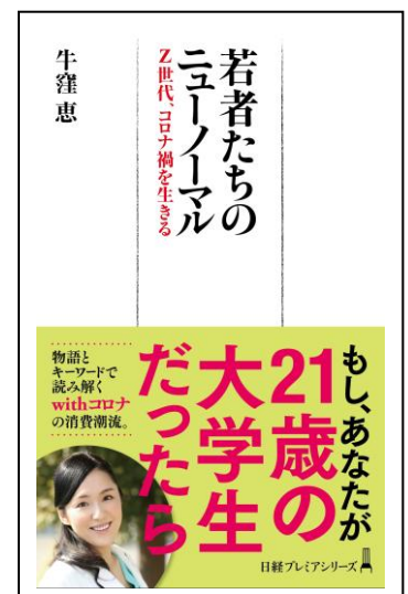
日経プレミアシリーズ (全316p/990円(税込))

彼らのリアルな生活ぶりや仕事観、恋愛・結婚・出産観、両親や祖父母、友達との関係、そして Z世代に顕著な「動画・SNSの利用シーン」 を、以下の3つの方向から読み解く、「 若者生活・体感型 」の 小説&マーケティング本 です。